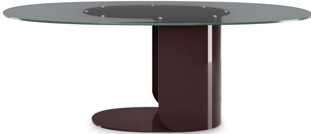
table 210x100 h 75 / Smoky glass top. Metal base lacquered col. RAL 3007.