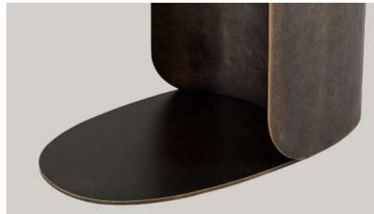
verniciatura bicolore Delabré Delabré bi-color finishing Delabré finition bicolore