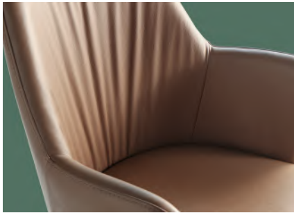
drappeggio drapery drapé