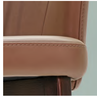
filo tono su tono thread tone on tone fil ton sur ton