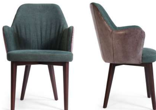
chair 59x59 h 87 / Outside-frame leather art. GHOST col. 35. Inside-frame and seat fabric art. ASOLO L1569 col. 12. Lacquered brown Oak wooden base.

Consulta i legni Discover the woods Consultez les bois