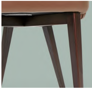
base in legno wooden base base en bois