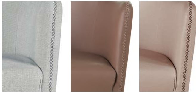
R4 ricamo con filo a contrasto embroidery with contrast stitching broderie avec coutures contrastées