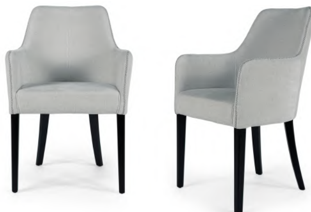
chair 59x59 h 85 / Fabric art. SORBARA col. 160 with detail embroidery R4. Thread col. 0033. Lacquered Wengé wooden feet.

Consulta i legni Discover the woods Consultez les bois