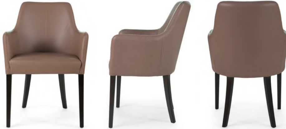
chair 59x59 h 85 / Leather art. SETA col. 71178 with detail embroidery R4. Thread col. 0605. Lacquered Wengè wooden feet.