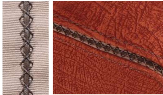
TRAP dettaglio di lavorazione manufacture detail détail de fabrication