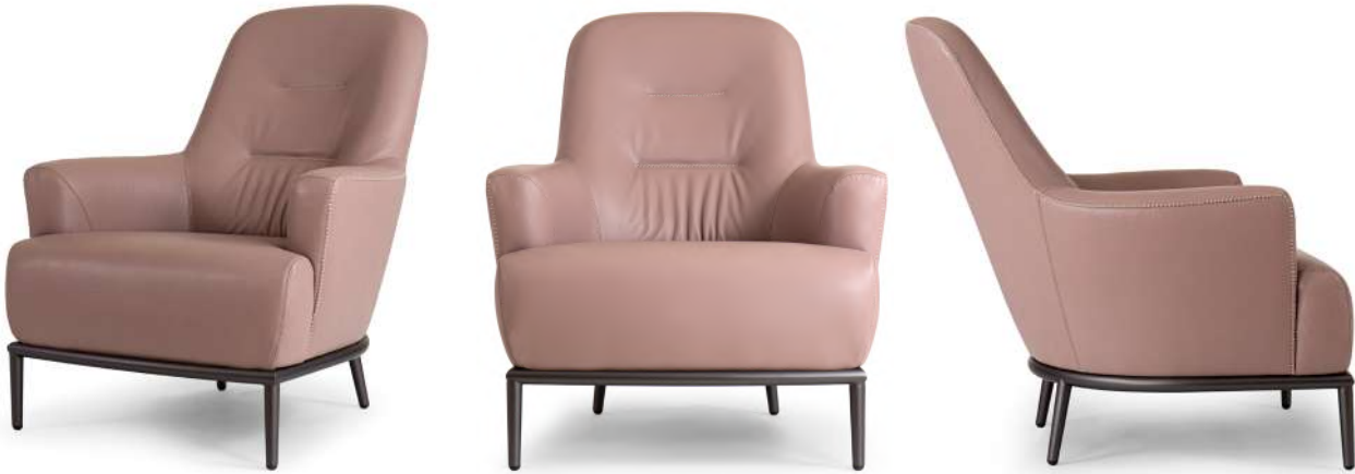
armchair 77x86 h 90 / Leather art. SETA col. 71829 with embroidery R2. Metal base finish col. Vulcan Grey.