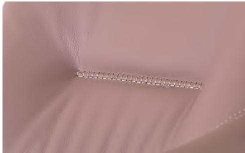
R2 ricamo embroidery broderie