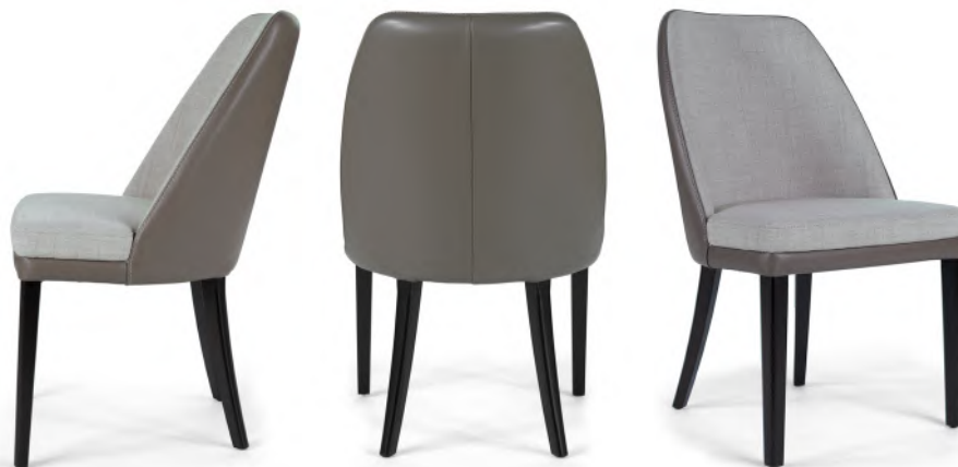
chair 59x59 h 86 / Outside frame Leather art. SETA col. 71194. Inside frame and seat cushion Fabric art. SORBARA col. 160. Thread col. 8362. Lacquered Wenge wooden feet.

Consulta i legni Discover the woods Consultez les bois