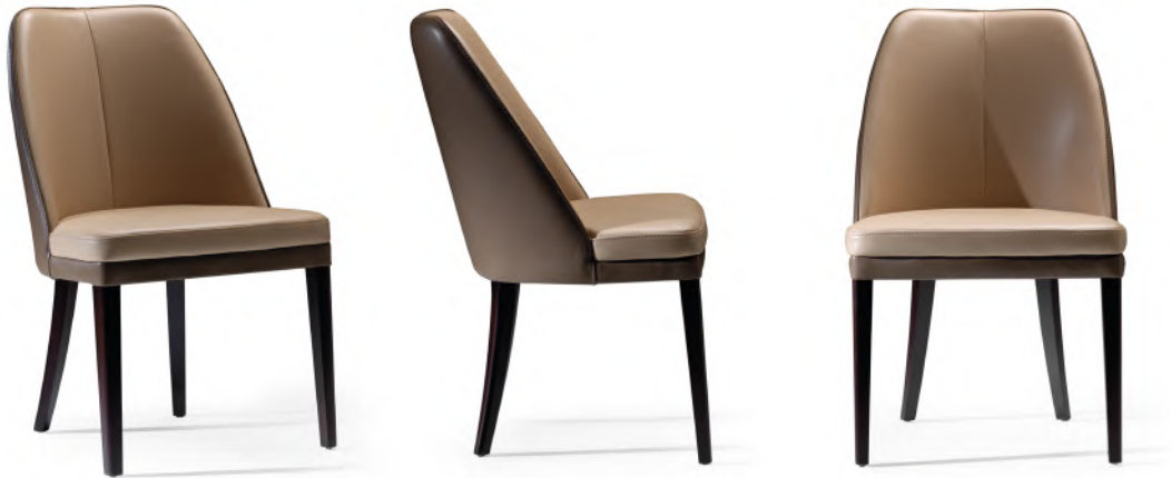
chair 55x59 h 86 / Outside frame Leather art. SETA col. 32488. Inside frame and seat cushion leather art. SETA col. 22211. Thread col. 8362. Lacquered Wengè wooden feet.