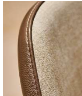
filo in contrasto thread contrast stitching surpiqure contrasté