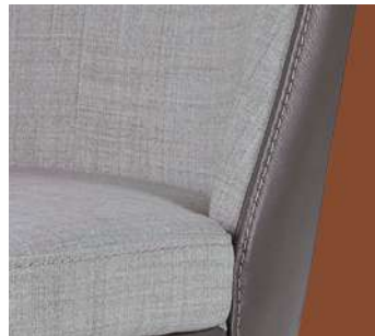
filo tono su tono thread tone on tone fil ton sur ton