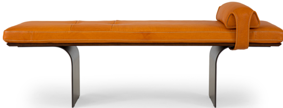
bench 150x45 h 46 / Seat+arm leather art. WATERFALL col. 45. Under seat lacquered Light Brown Oak. Metal feet finish col. Vulcan Grey.