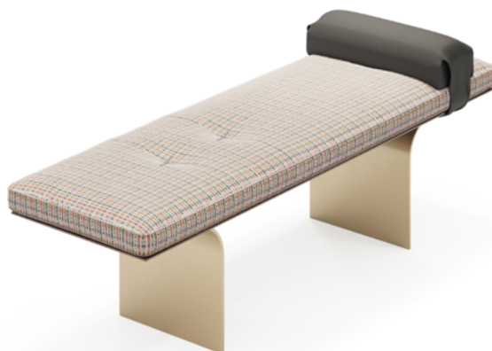
bench 150x45 h 46 / Seat fabric art. KUBOA 9072 col. 04. Arm leather art. SEQUOIA col. 4027. Under seat lacquered Light brown oak wood. Metal feet finish col. YY2761 Beige.

Consulta i legni Discover the woods Consultez les bois