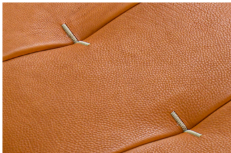
cucitura a Zig-Zag compatto compact Zig-Zag stitching coudre Zig-Zag compacte