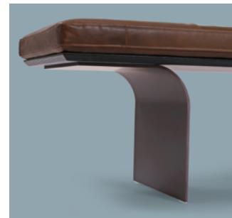
piedi in metallo metal feet pieds en métal