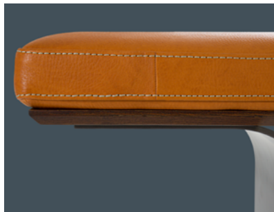
sottopiano in legno wooden support top panneau de soutien en bois