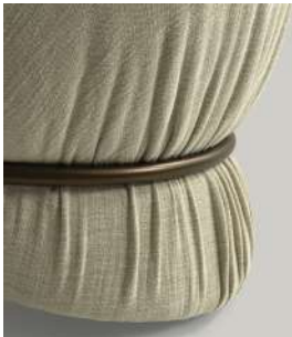
pieghe pleats plis