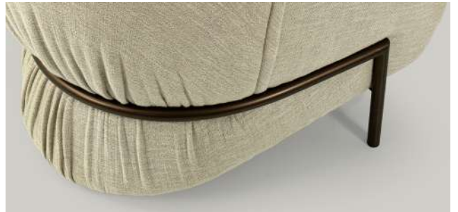
tubolare metallico tubular metal métal rond