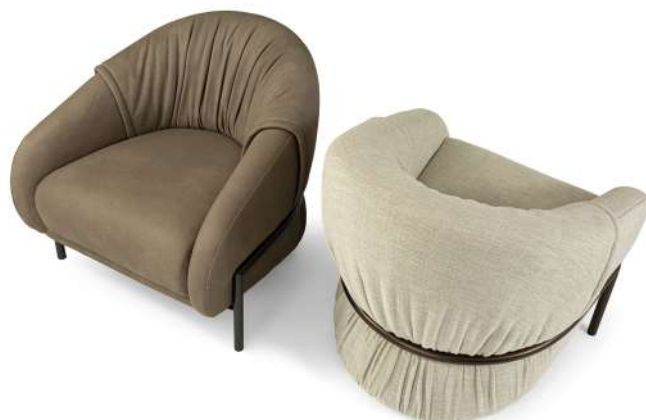
armchair 85x90 h 80

Consulta i metalli Discover the metals Consultez les métaux