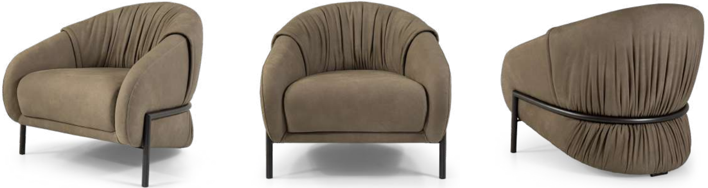
armchair 85x90 h 80 Leather art. SEQUOIA col. 4003. Metal base finish col. Vulcan Grey.