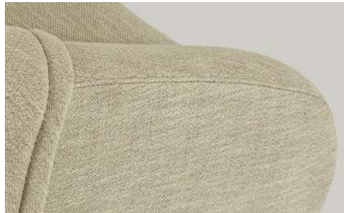
cuciture decorative decorative stitching coutures décoratives