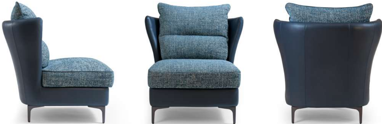
armchair 81x85 h 86 / Frame leather art. SETA col. 80667. Seat and back fabric art. PORTO CERVO L1571 col. 82 with trimming leather art. SETA col. 80667. Metal feet finish col. Vulcan Grey.