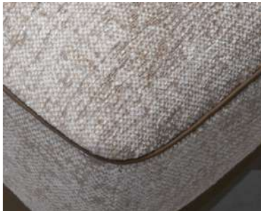
bordino trimming passepoil