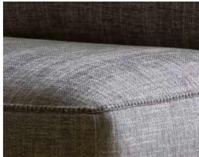
R3 ricamo embroidery broderie