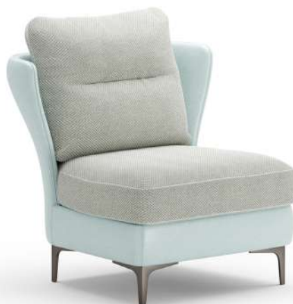
armchair 81x85 h 86 / Leather art. SETA col. 86320. Fabric art. BUNNIE col. 02 with trimming leather art. SETA col. 86320. Metal feet col. Anodic Bronze.

Consulta i metalli Discover the metals Consultez les métaux