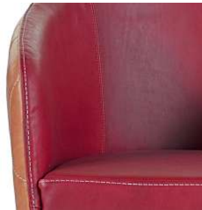
filo in contrasto thread contrast stitching surpiqure contrasté