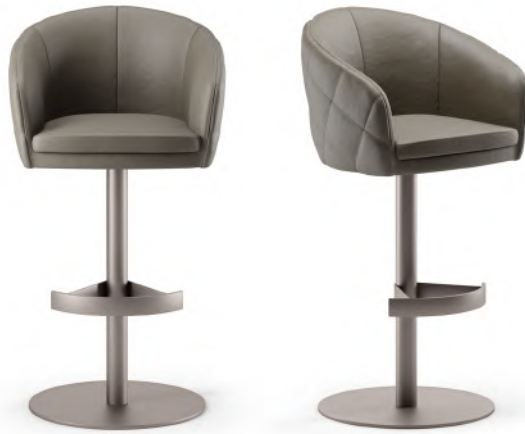
stool 60x56 h 110 / Outside-frame, inside-frame and seat leather art. PRESCOTT col. 210. Thread col. 00519. Metal base finish col. Anodic Bronze.