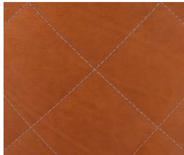
trapuntatura quilting matelassage