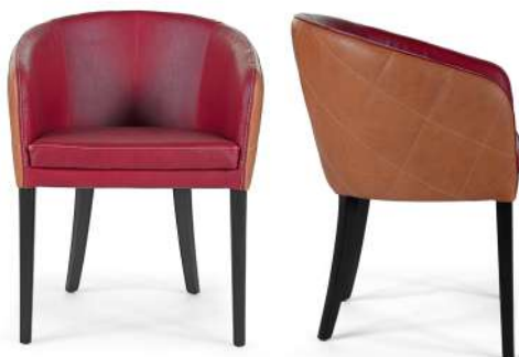
Outside-frame leather art. TUSCANIA col. 26. Inside-frame and seat leather art. TUSCANIA col. 28. Thread col. 0247. Lacquered Brown Oak wooden base.

Consulta i legni Discover the woods Consultez les bois