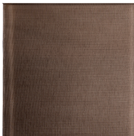
SILVER MESH ON BRONZE (VT2)