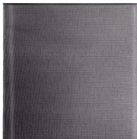
SILVER MESH ON SMOKY (VT2)