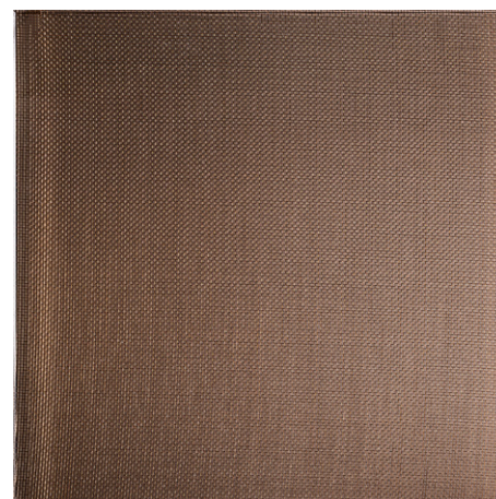
GOLDEN MESH ON BRONZE (VT2)

Tutte le immagini sono inserite a scopo illustrativo, i colori sono puramente indicativi e possono differire dai toni reali. All images are shown for illustrative purposes, the colors are purely indicative and may differ from the real tones. Toutes les images sont présentées à titre d'illustration, les couleurs vues sur l'écran sont purement indicatives et peuvent différer des tons réels.