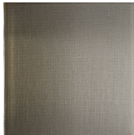
GOLDEN MESH ON SMOKY (VT2)