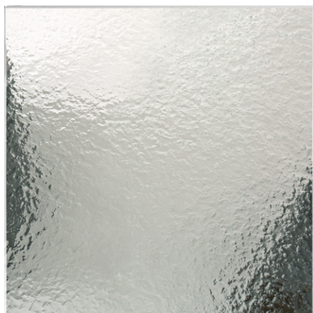
MARTELLATO / HAMMERED / MARTELÉ (VT3)

Travaillé en four à fusion, le verre martelé a pour effet de créer un mouvement de montées et descentes sur la surface. Tant à la vue qu'au toucher il restitue un effet extrêmement riche et materique.