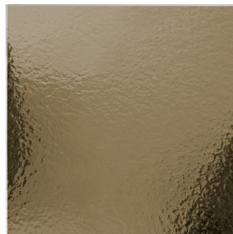
MARTELLATO / HAMMERED / MARTELÉ BRONZE (VT3)

Tutte le immagini sono inserite a scopo illustrativo, i colori sono puramente indicativi e possono differire dai toni reali. All images are shown for illustrative purposes, the colors are purely indicative and may differ from the real tones. Toutes les images sont présentées à titre d'illustration, les couleurs vues sur l'écran sont purement indicatives et peuvent différer des tons réels.