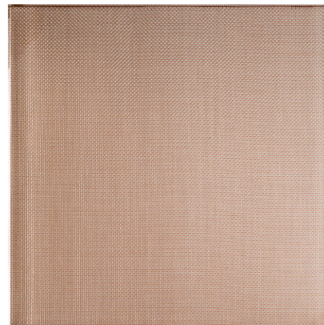
GOLDEN MESH ON EXTRA CLEAR (VT2)