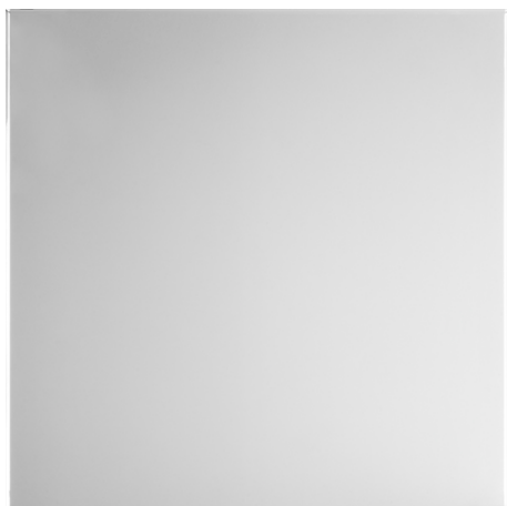
EXTRA CLEAR (VT1)

Les verres mesh sont une nouveauté esthétique et technologique. Très particuliers, est l'union d'une maille métallique, d'argent ou d'or, à l'intérieur de deux couches de verre de toute couleur. Ainsi pour créer très élégantes combinaisons de textures et verre uni. En cas de rupture les mailles métalliques retiennent les éclats de verre.